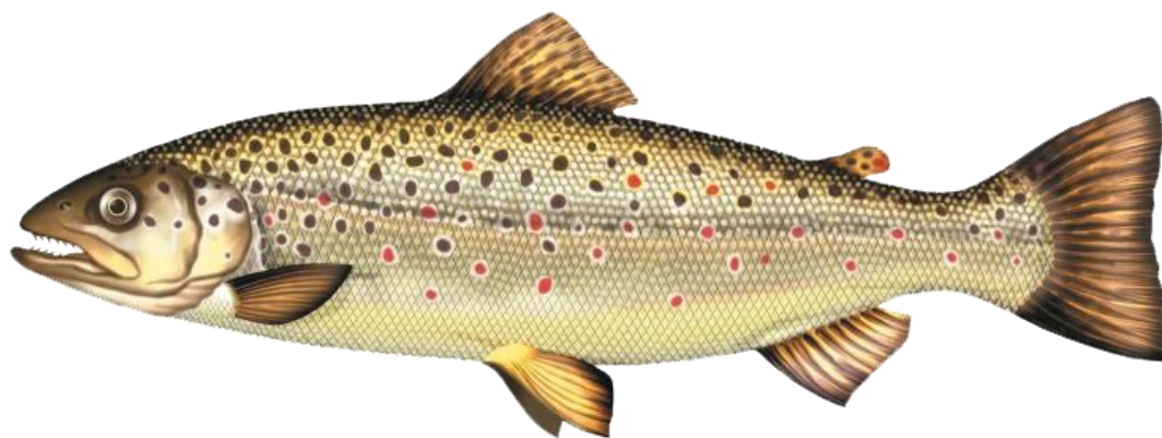
La truite fario