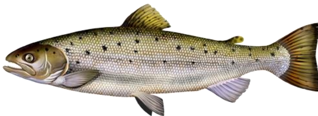
La truite de mer

(En cours d'implantation sur l'Austreberthe) No-kill